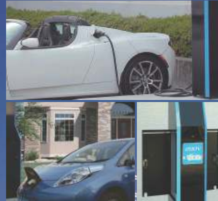
ツイン充電(標準装備)

EV/PHV向けの200V普通充電機能を装備。 テスラなどの輸入車にも対応可能です。